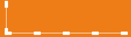
Verlauf über Eck – RTW-Ve